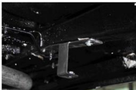
Рис.4 Установка крепления 2