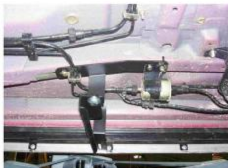
Рис.5 Установка среднего кронштейна