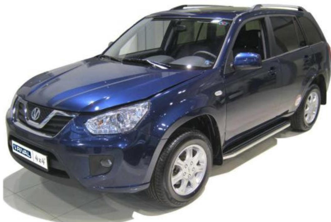
Рис.8 Вид автомобиля с порогом