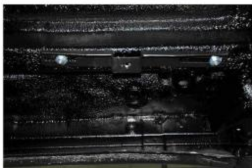
Рис.2 Установка крепления 1