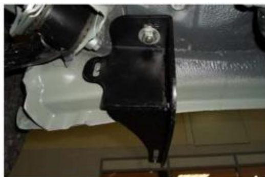
Рис.7 Установка заднего кронштейна