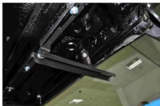
Рис.3 Установка переднего кронштейна