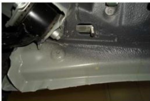
Рис.6 Установка шпильки закладной М10