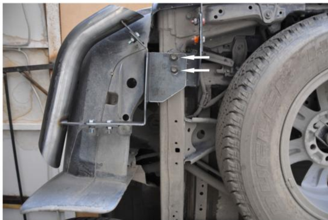
Рис. 1 Установка левого кронштейна