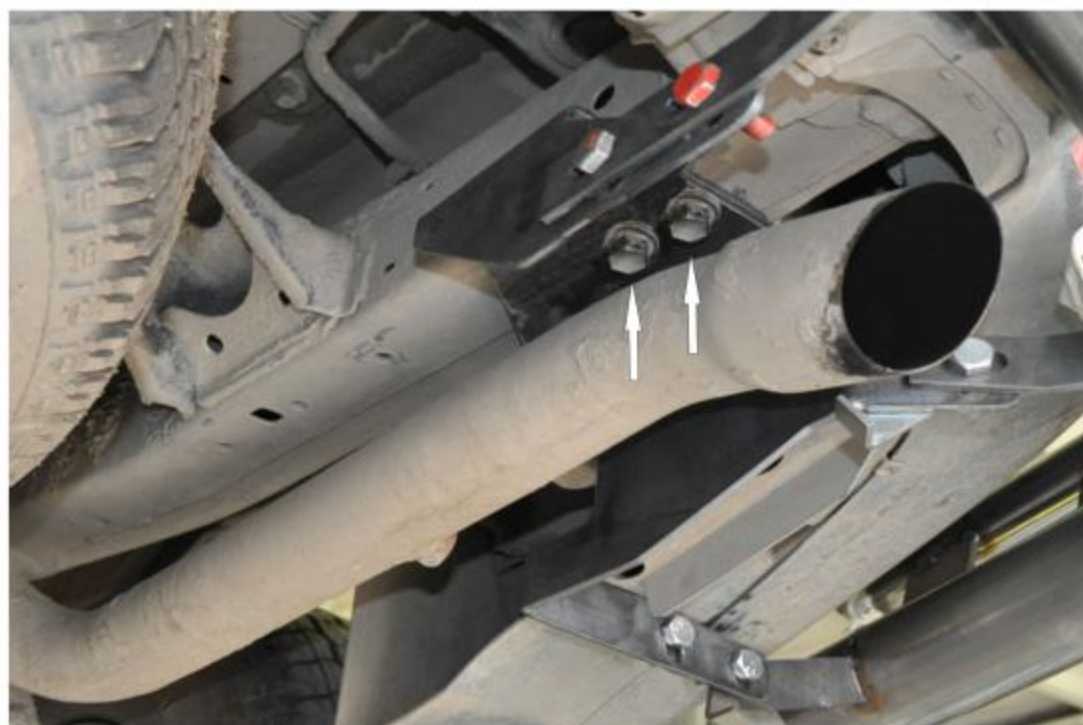
Рис. 2 Установка правого кронштейна