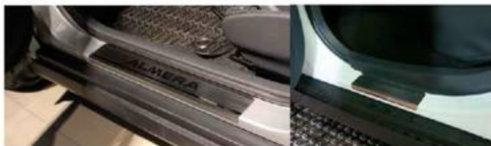
Фото установленных накладок

Накладки на остальные пороги устанавливаются аналогичным образом.