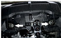
Рис. 1 - Установка кронштейнов