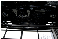
Рис. 2 - Установка защиты