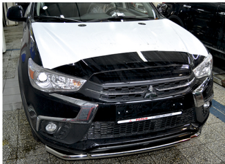
Рис. 3 - Общий вид автомобиля с защитой