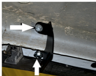
Рис. 1 - Установка переднего кронштейна