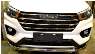
Рис. 3 - Общий вид автомобиля с защитой