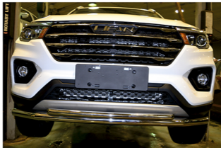
Рис. 3 - Общий вид автомобиля с защитой